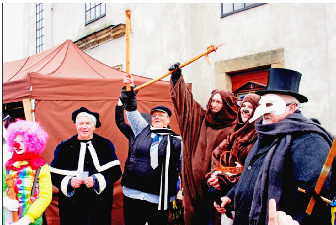
Všechny tři masopustní průvody ukončily své putování u kostela sv. Kateřiny (čtete na str. 4–5), foto Josef Zoser

V sobotu 17. března 2018 od 16 h. ve Spolkovém domě (Jiřetín pod Jedlovou, Náměstí Jiřího č.p. 36)