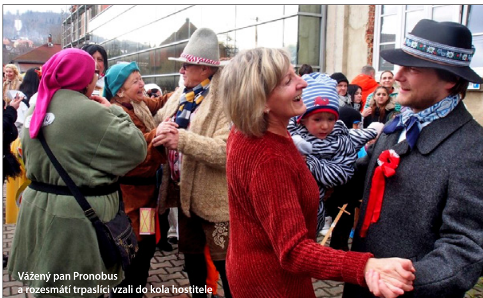
Vážený pan Pronobus a rozesmátí trpaslíci vzali do kola hostitele