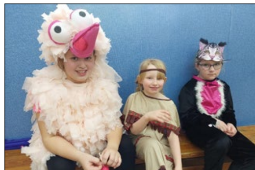
Z karnevalového veselí v základní škole